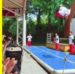
●実際のパフォーマンス中の写真です。